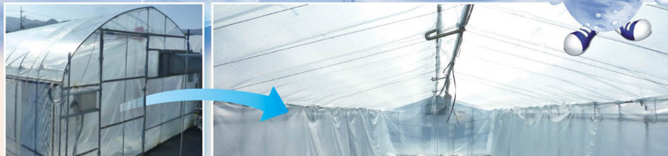
※「内張りサイド」としての使用例