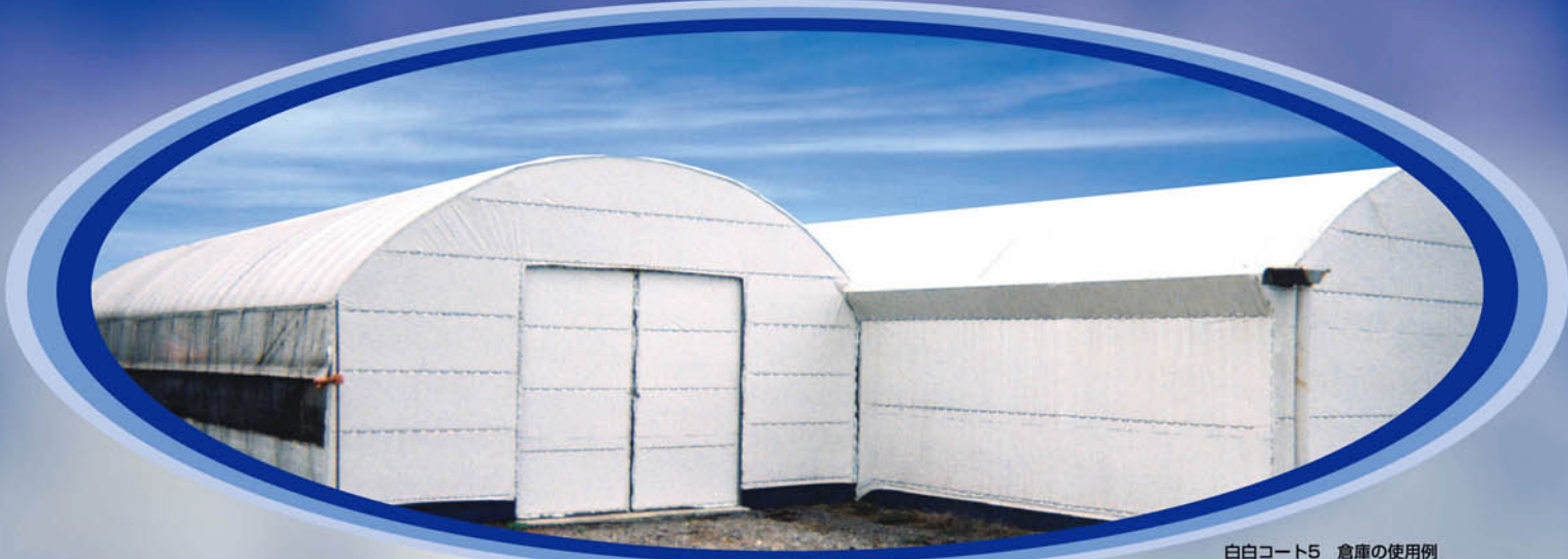
白白コート5 倉庫の使用例