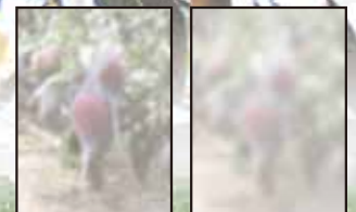
パールメイトST 梨地農ビ フィルムの後方約30cmでの作物の 見え方の差(0.1mm厚)